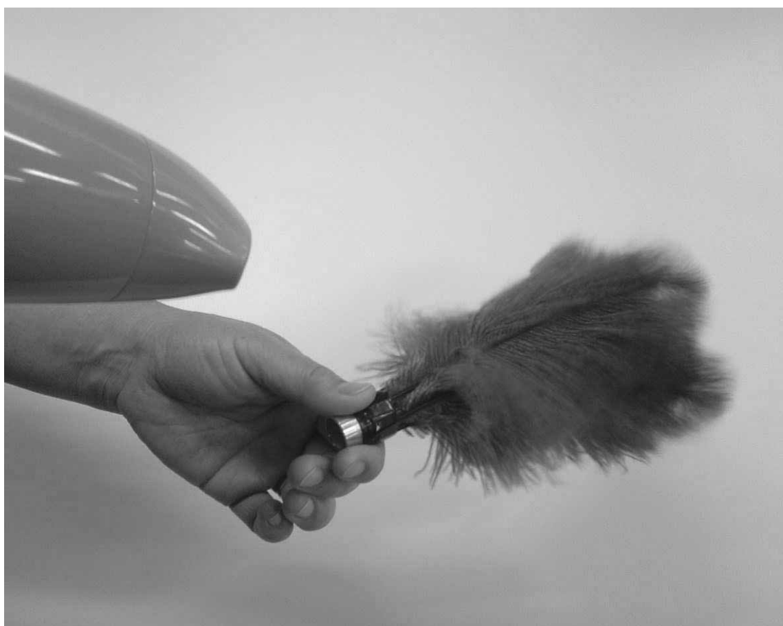
みつばち花子・毛ばたき花子 羽毛の取扱